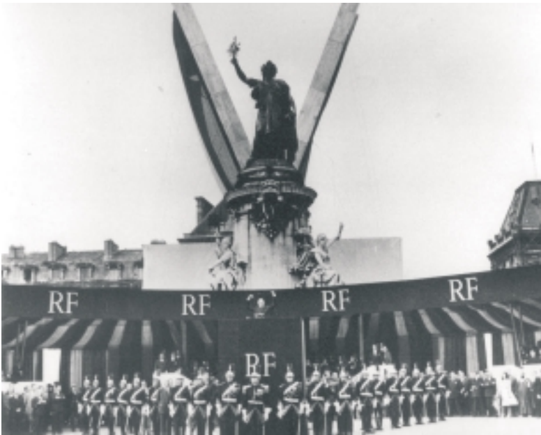
Présentation de la Constitution le 4 Septembre 1958. Discours de De Gaulle Place de la République à Paris.

Début de l'examen du projet de Constitution par le Comité Consultatif Constitutionnel