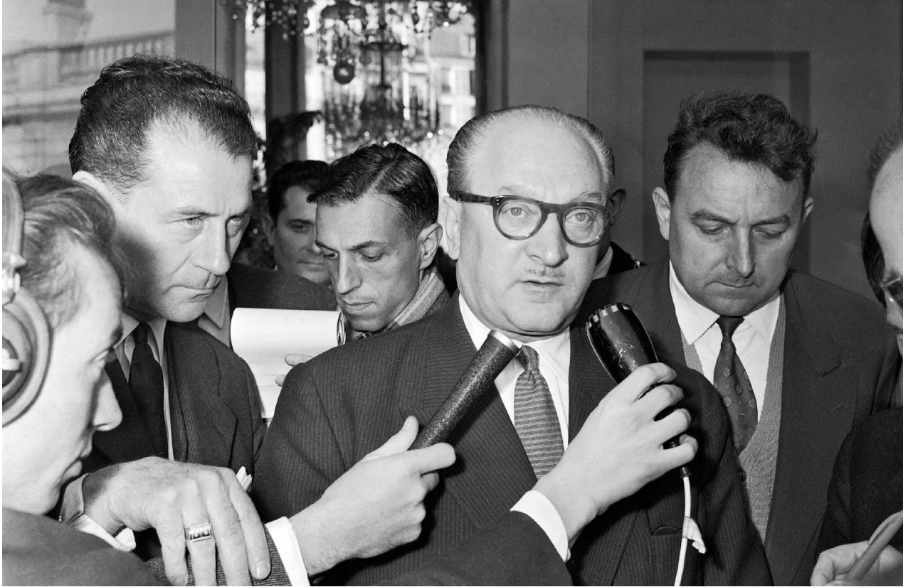
◀ Guy Mollet, pressenti pour être chef du gouvernement, est reçu par le président de la République, René Coty, à l'Élysée, 1957.