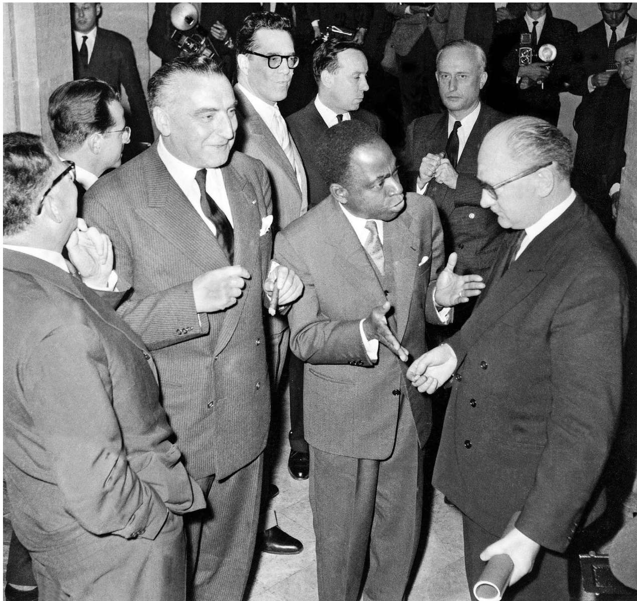
► Réunion du Comité consultatif constitutionnel en présence des ministres Louis Jacquinot, Félix Houphouët-Boigny, Guy Mollet au premier plan, Michel Debré et Pierre Pflimlin au second plan. Été 1958.

le temps de la délibération budgétaire ainsi que le droit d'amendement, en accélérant la procédure législative par la création de la commission paritaire, en rendant très difficile l'usage de la motion de censure ou encore par la création du Conseil constitutionnel chargé d'examiner « la valeur de la loi ».