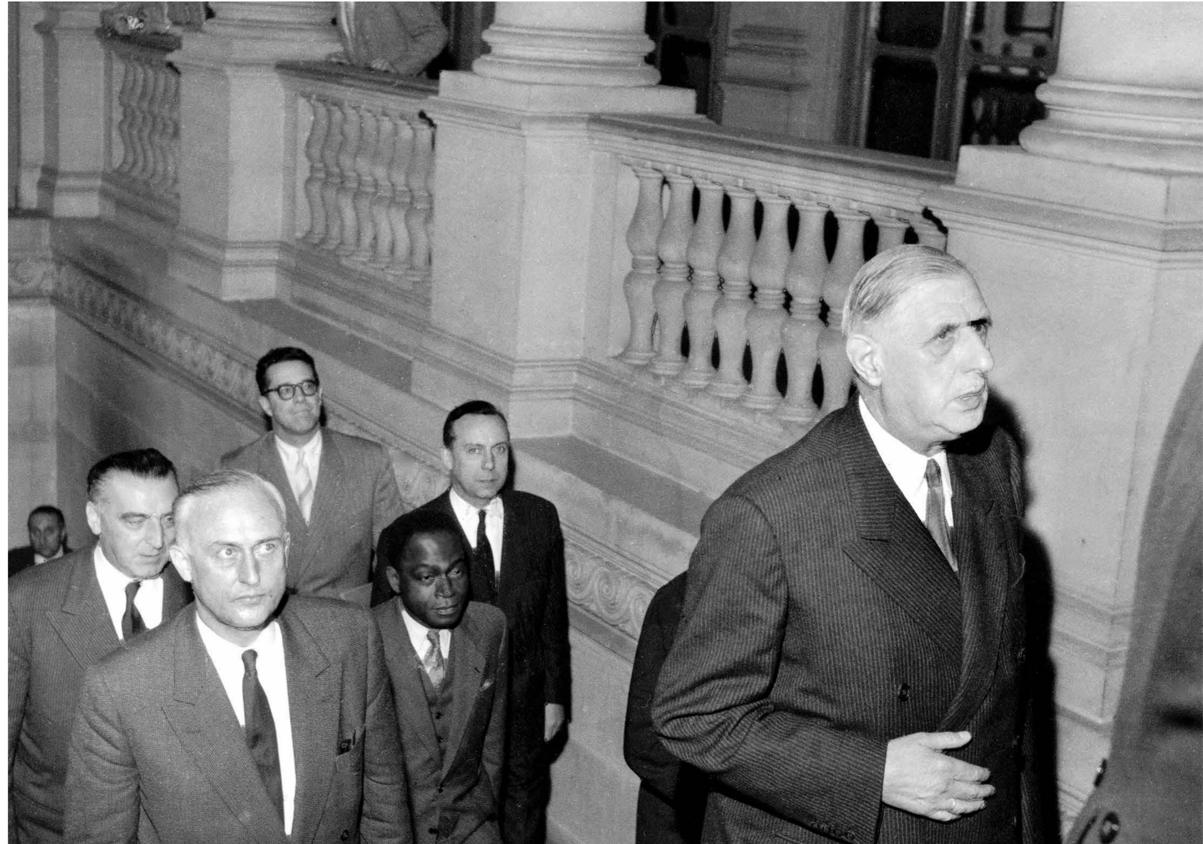
4 Le général de Gaulle présente l'avant-projet constitutionnel au Comité consultatif constitutionnel, 8 août 1958. Il est suivi de Pierre Pflimlin, Louis Jacquinot, Félix Houphouët-Boigny et Michel Debré.

On notera par ailleurs que le garde des Sceaux commence sa présentation par la restauration d'un véritable régime parlementaire, rejetant dos à dos ce qu'il appelle le «régime conventionnel», ou «régime d'assemblée», «où la totalité du pouvoir, en droit et en fait, appartient à un Parlement», et le «régime présidentiel». Il exprime le souci de s'inscrire dans la continuité de l'histoire parlementaire de la France, mais en instaurant ce que l'on appelle «le parlementarisme rationalisé», c'est-à-dire l'encadrement du travail législatif, idée exprimée par de nombreux juristes depuis le début du XX e siècle. Michel Debré entend la concrétiser en confiant en majorité au gouvernement l'ordre du jour de l'Assemblée, en limitant le nombre des commissions,