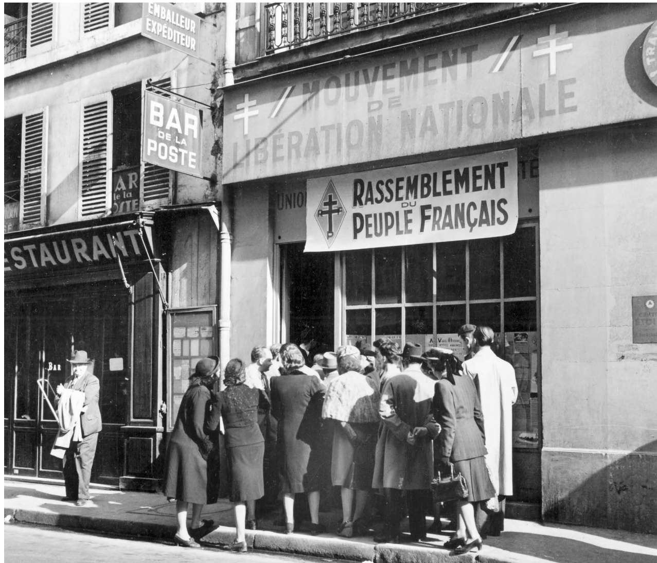
► Des sympathisants attendent pour s'inscrire devant une permanence du Rassemblement du peuple français, avril 1947.

fait part belle aux ténors de la IV e République, qui ont accepté son retour au pouvoir, le socialiste Guy Mollet, le MRP Pierre Pflimlin, l'indépendant Louis Jacquinot, Félix Houphouët-Boigny, représentant la France d'outre-mer, tous quatre nommés ministres d'État. Mais afin de bien marquer sa différence avec ses prédécesseurs, et contrairement à tous les usages, il se contente de prononcer son discours d'investiture avant de s'éclipser au moment des réponses des groupes parlementaires. Ensuite, par la loi sur les pleins pouvoirs promulguée le 3 juin 1958, les députés lui accordent la possibilité de gouverner par ordonnances pour une durée de six mois, tandis que la loi constitutionnelle du même jour l'autorise à mener à bien la réforme des institutions du pays. Il faut néanmoins observer que cette loi constitutionnelle du 3 juin énumère cinq grands principes afin d'encadrer le projet constitutionnel gaulliste.