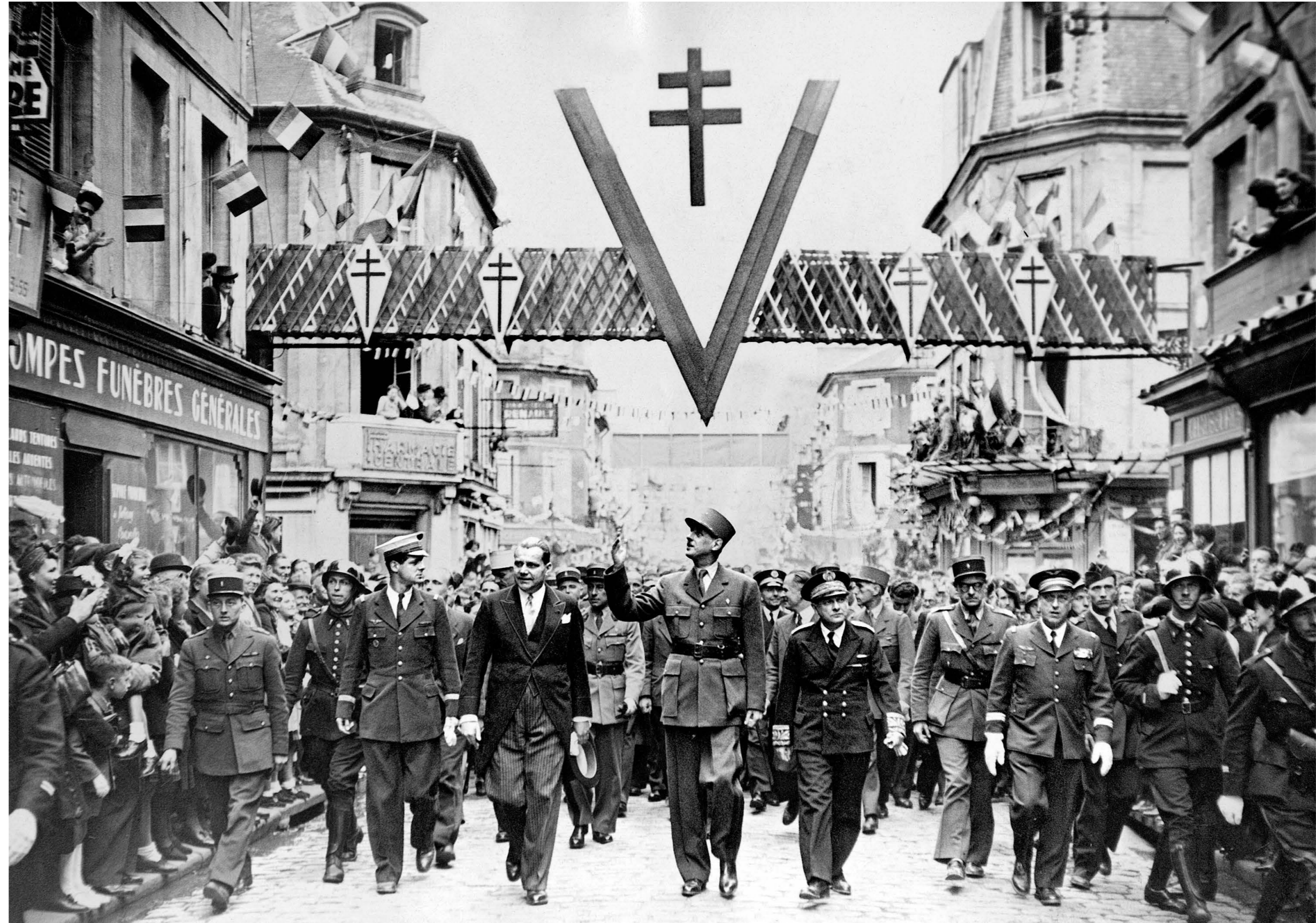
4 Le général de Gaulle, à Bayeux, 16 juin 1946.

C'est bien la menace d'un coup de force qui précipite son retour au pouvoir, car, le 24 mai, les putschistes d'Alger lancent une opération aéroportée en Corse. Sans effusion de sang, cette opération, baptisée Résurrection , se concrétise par la création le 26 mai d'un second Comité de salut public à Ajaccio et par l'envoi d'un ultimatum à Paris, tandis qu'une partie de l'armée d'Algérie prépare secrètement – en liaison avec les gaullistes – un débarquement des paras sur la capitale. Le 27 mai, alors qu'il n'a pas pu trouver d'accord avec Pflimlin lors d'une entrevue secrète la veille, le général de Gaulle affirme qu'il a «entamé [...] le processus régulier nécessaire à l'établissement d'un gouvernement républicain capable d'assurer l'unité et l'indépendance du pays».