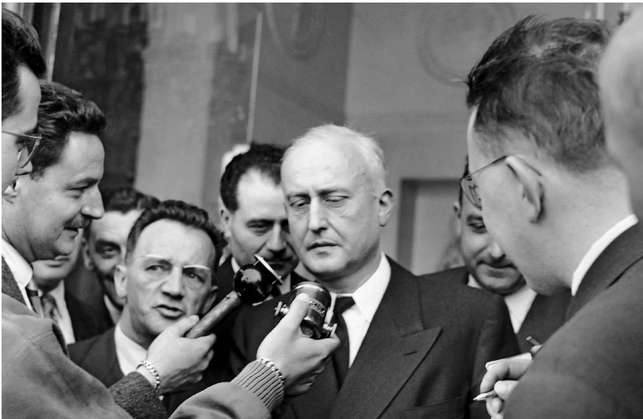
◀ Pierre Pflimlin, pressenti pour assurer la présidence du Conseil, sort de l'Élysée, 5 mai 1958.