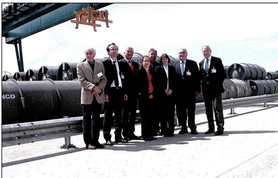
Visite de la délégation du Haut comité à Capenhurst (Grande-Bretagne) le 27 mai 2010