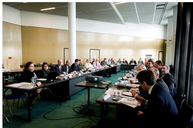
Réunion plénière du Haut comité

Le Haut comité pour la transparence et l'information sur la sécurité nucléaire a tenu 4 réunions plénières en 2010 au cours desquelles les sujets suivants ont été examinés :