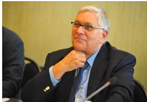
Henri REVOL – Président du HCTISN

L'année 2010 est la seconde année complète de fonctionnement du Haut comité pour la transparence et l'information sur la sécurité nucléaire, que j'ai l'honneur de présider depuis son installation le 18 juin 2008 en présence du ministre d'Etat, ministre de l'écologie, de l'énergie, du développement durable et de la mer, Jean-Louis BORLOO.