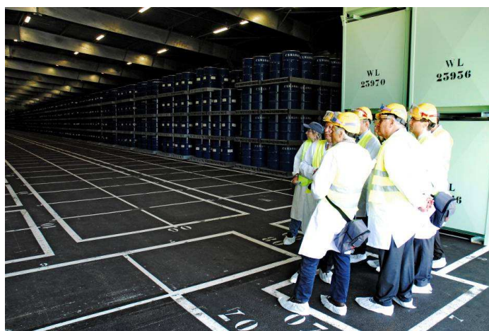
Visite de la délégation du Haut comité sur le site du Tricastin le 1 er juin 2010