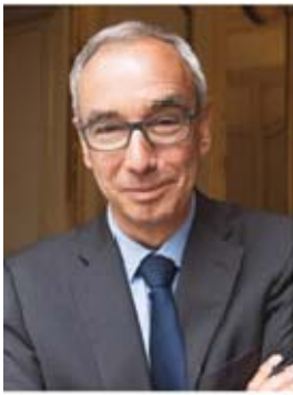
Jean Pisani-Ferry Commissaire général de France Stratégie

En dépit de la hauteur des barrières que les institutions économiques, sociales et politiques de notre pays opposent aux jeunes, le conflit entre générations n'a pas, aujourd'hui, d'existence politique visible. Les partis, syndicats ou associations qui structurent notre vie collective existaient presque tous il y a vingt ou trente ans, quand ce n'est pas beaucoup plus.