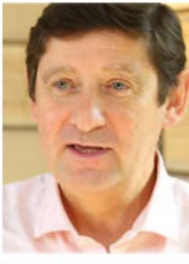
Patrick Kanner Ministre de la Ville, de la Jeunesse et des Sports

Un lieu commun circule : les jeunes seraient désintéressés des affaires de la cité, ils seraient repliés sur eux-mêmes, à l'écart de la vie collective. La première vertu de ce rapport est de tordre le cou à cette vision péjorative de la jeunesse. Une nation qui n'a pas confiance en sa jeunesse est une nation qui n'a pas confiance en son avenir. Nous devons retrouver fierté et optimisme, et cela passe entre autres par le fait de laisser toute sa place à la jeunesse.