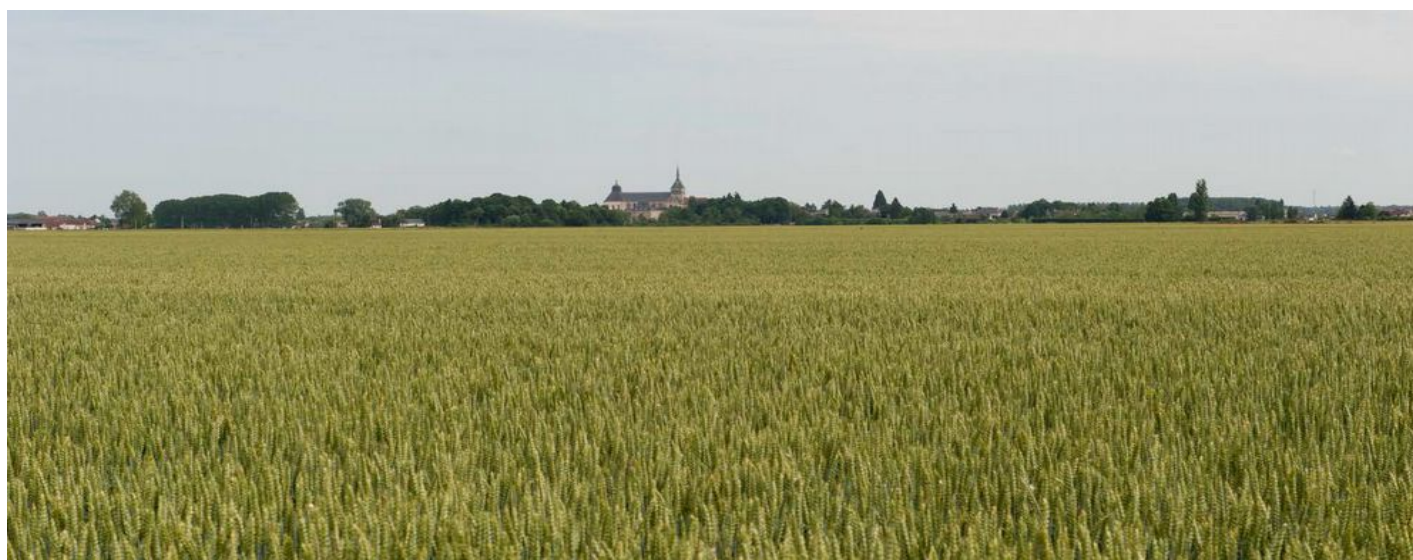
L'abbaye vue depuis le sud – Source DREAL Centre-Val-de-Loire