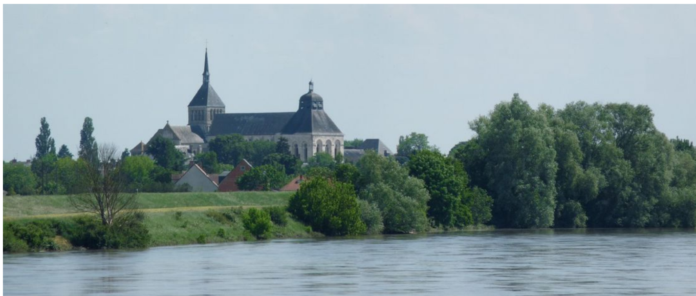
L'abbaye de Saint-Benoît-sur-Loire vue depuis le fleuve