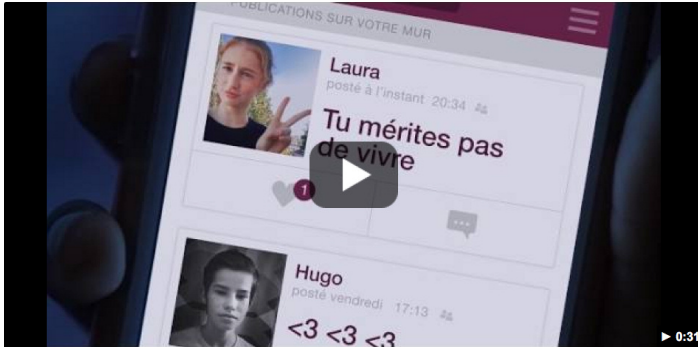
LIKER, C'EST DÉJÀ HARCELER - YouTube YouTube · Rose Carpet

À l'occasion de la seconde journée nationale « Non au harcèlement », le 9 novembre 2016, le ministère de l'Éducation nationale a présenté le clip « Liker, c'est déjà harceler ». Réalisé par la chaîne Rose Carpet, à l'initiative du ministère de l'Éducation nationale, et avec le soutien de YouTube et Google, ce clip de sensibilisation face aux risques du harcèlement en ligne a été diffusé à la télévision et sur le web.