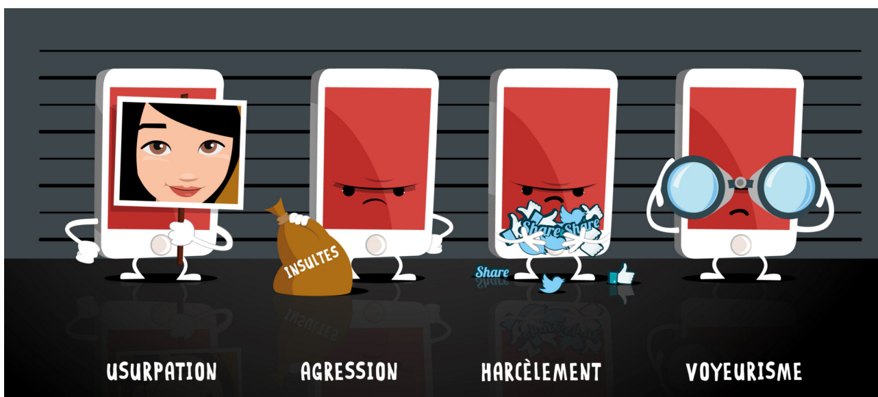
Illustration du Centre Hubertine Auclert, 2015

Le Centre Hubertine Auclert s'est emparé du sujet des violences faites aux femmes en ligne et a mené en avril 2015 une campagne de sensibilisation et de prévention abordant les différentes formes de violences sexistes et sexuelles faites aux femmes en ligne. Les thèmes du cyber contrôle et de la cybersurveillance sont présents à travers le terme « voyeurisme ».