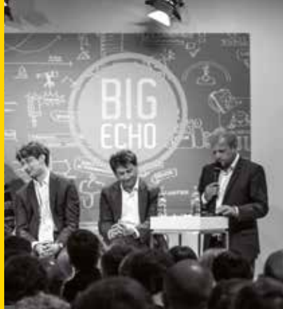
Xavier Niel, Fondateur de Free