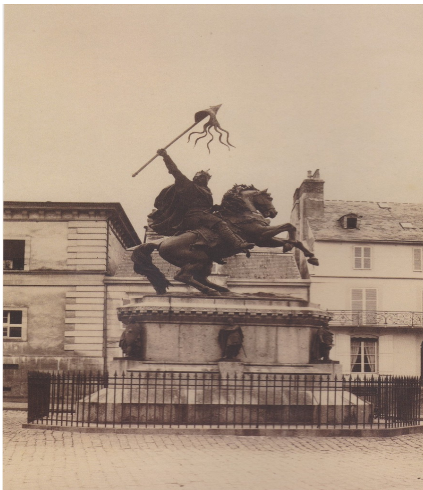
Statue de Guillaume Le Conquérant à Falaise