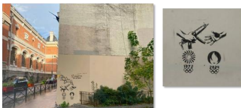
Graffitis prétendument localisés au 13 rue Buffon, Paris 5 ème , à 750m de la Grande Mosquée de Paris

VIGINUM a également observé une tentative d'instrumentalisation d'actions menées dans le champ physique, notamment via la diffusion de photos de graffitis prétendument apposés sur les murs de Paris. Au mois de novembre 2023, VIGINUM a détecté sur les plateformes Telegram , VK , Facebook et X , plusieurs photos de graffitis représentant deux mains se transmettant une arme au-dessus des logos des Jeux Olympiques de Munich de 1972 et de Paris 2024 7 . La diffusion de ces photos de graffitis, dont l'authenticité n'a pas pu être démontrée, avait été amplifiée par plusieurs comptes présentant des caractéristiques inauthentiques, notamment rattachés au dispositif RRN 8 .