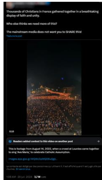
Capture d'écran d'une publication d'une vidéo décontextualisée sur X

En outre, à partir du 28 juillet et, à la suite de la cérémonie d'ouverture, plusieurs comptes X identitaires et ultra-conservateurs, à nouveau anglophones et hispanophones, ont diffusé une vidéo décontextualisée faisant apparaître « des milliers de chrétiens » qui se seraient réunis en France pour protester contre la cérémonie d'ouverture, jugée « anti-chrétienne ». Or, cette vidéo avait été initialement partagée le 15 août 2022 à l'occasion de la fête de l'Assomption.