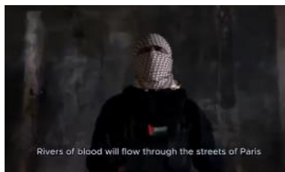
Capture d'écran de la vidéo du prétendu membre du Hamas

Au mois de juillet 2024, VIGINUM a également détecté quelques jours avant la cérémonie d'ouverture, la publication d'une vidéo sur X , Facebook et Telegram , faisant apparaître un prétendu membre du Hamas menaçant les JOP24 et la France, accusant celle-ci de soutenir Israël et dénonçant la participation d'athlètes israéliens à la compétition. Si l'individu s'adresse dans un arabe correct, son discours comporte des fautes d'intonation, suggérant qu'il pourrait ne pas s'agir de sa langue maternelle. Amplifiée grâce à plusieurs publications d'articles dans des médias africains, potentiellement rémunérés, cette manœuvre a été attribuée par le Centre d'analyse de la menace de l'entreprise Microsoft au mode opératoire russe Storm-1516 6 .