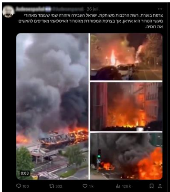
Captures d'écran d'une publication du montage des vidéos sur X

Concomitamment à la cérémonie d'ouverture, VIGINUM a détecté la diffusion par des comptes X qui se présentent comme nationalistes indiens, pro-TRUMP et pro-Israël d'un montage de trois vidéos décontextualisées faisant apparaître des infrastructures et des véhicules en feu à Paris. Or, ce même montage avait déjà été diffusé lors des faits de violences urbaines à Nanterre en juillet 2023, preuve du caractère manifestement trompeur de ces publications.