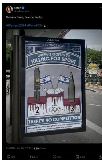
Affiche appelant au boycott des JOP24 dans un abris-bus du 20 ème arrondissement parisien

À titre d'exemple, VIGINUM a détecté le 26 juillet 2024 une photo d'un affichage publicitaire d'un abribus du 20 ème arrondissement détourné pour cibler la délégation olympique israélienne. Cette photo a été massivement reprise, notamment sur X, dans la majorité par des comptes pro-palestiniens.