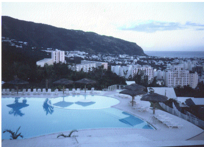
Figure 1 : en arrière-plan, vue du site de "La Montagne" et de la topographie locale

Pour des vitesses de vent importantes concernant des zones habitées en altitude la météorologie nationale relève 220 km/h au centre de la plaine des Cafres à 1 560 m d'altitude. Cela correspond grossièrement sur site météo local à un vent moyen de 40 m/s. Si l'on s'appuie sur le document de Didier Delaunay fournissant la cartographie des vents cycloniques dans les départements d'Outre-Mer, on constate que la vitesse de référence du vent sur site météo dans cette zone est de l'ordre de 42 m/s (vent de durée de retour 50 ans), ce qui conduit pour les valeurs relevées lors du passage de Dina à la plaine des Cafres à une durée de retour de l'ordre de 30 ans.