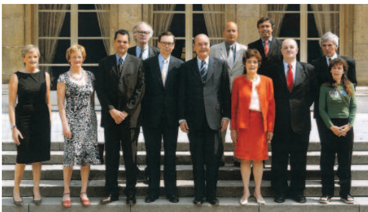
Installation officielle du collège de la HALDE par M. Jacques Chirac, Président de la République, le 23 juin 2005.

Le collège de la Haute Autorité de Lutte contre les Discriminations et pour l'Égalité a tenu 22 séances de délibération durant la période du 6 mars 2005 au 28 février 2006.