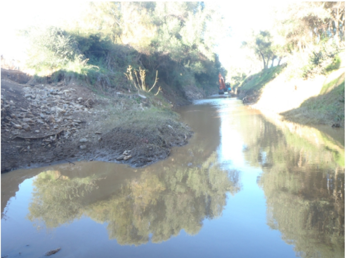
Photo prise de l'aval du Pansard. La pelle travail en pleine eau, sans dispositif de piégeage des fines.