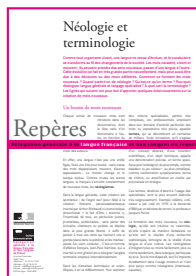
Néologie et terminologie 2011