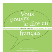
Bien traiter la nature... 2013