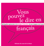
Alchimie des mots de la chimie 2011