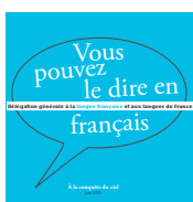
À la conquête du ciel 2011