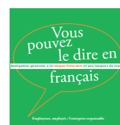
Employeurs, employés : l'entreprise responsable 2012