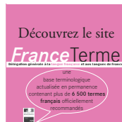
FranceTerme : la base des termes officiellement recommandés 2013