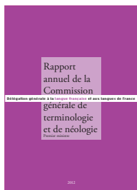
Rapport annuel de la Commission générale de terminologie et de néologie 2012