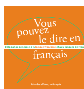
Faire des affaires, en français 2012