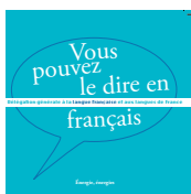
Énergie, énergies 2013