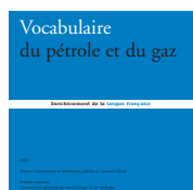
Pétrole et gaz 2007