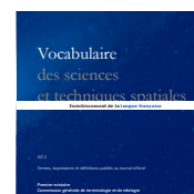
Sciences et techniques spatiales 2013