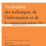
Techniques de l'information et de la communication (TIC) 2009