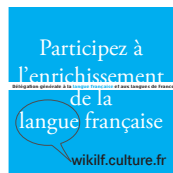
WikiLF : un site pour encourager la création lexicologique 2013