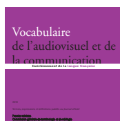
Audiovisuel et communication 2010