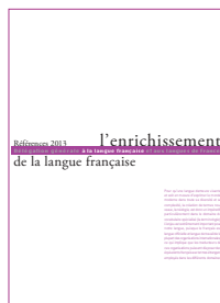
L'enrichissement de la langue française 2013