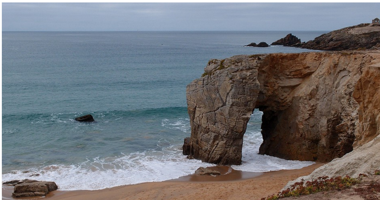
Les falaises de Port-Blanc (Côte sauvage) à St-Pierre-Quiberon

La pression touristique sur le milieu naturel est considérable. Des études de notoriété montrent que le site est un des plus fréquentés de Bretagne. Si les plages connaissent un afflux massif sur la période estivale, la presqu'île de Quiberon attire nombre de visiteurs toute l'année. Selon le dossier, ce sont plus d'un million de vacanciers par an qu'il faut accueillir, informer, loger, guider, dans le souci permanent d'éviter que leur passage ne dégrade des milieux fragiles, de surcroît soumis aux aléas du climat.