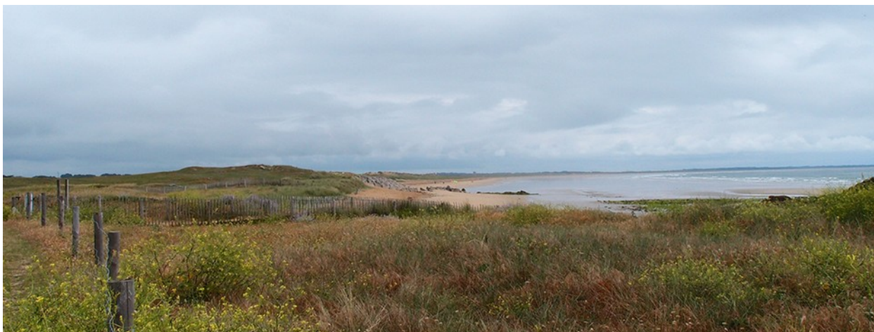
Les dunes et la côte de Kerhilio à Erdeven

Malgré ces atteintes, les paysages du site conservent un intérêt tel qu'il a justifié nombre de protections réglementaires : site classé de la côte sauvage de la presqu'île de Quiberon (1936) ; site classé des dunes et étangs littoraux de Gâvres et de Plouhinec (1977) ; deux sites inscrits des zones dunaires de Gâvres et de Plouhinec (1981). Le classement du site des dunes de Plouharnel et d'Erdeven est en cours d'instruction, votre commission ayant donné un avis favorable à sa protection le 14 juin dernier. Au total, le bénéfice de cette protection s'étendra sur quelque 8 500 hectares d'espaces naturels dont 6 000 de domaine public maritime, représentant la majeure partie du périmètre du Grand Site.