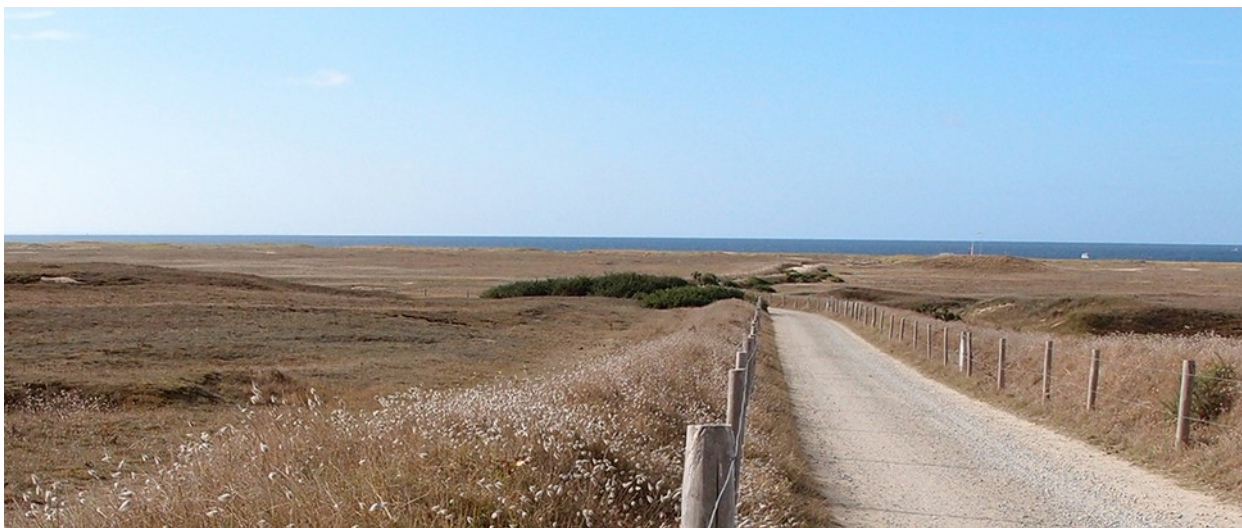
Canalisation des flux et reconquête de la dune grise – secteur de Kervegan à Plouhinec

travaux : requalification des paysages dégradés (Côte sauvage, pointe du Conguel à Quiberon, pointe des Saisies à Gâvres, dunes de Kerhilio), recul de parkings, protection des milieux naturels contre le piétinement, réalisation d'une tranche de la voie verte entre Quiberon et la ria d'Étel. Le montant total de ces travaux est d'environ 1,7 millions d'euros.