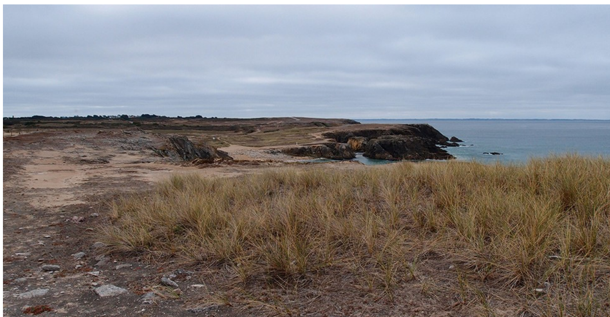
Les sols de la côte rocheuse à Port-Blanc : une difficile reconquête

Votre rapporteur s'est rendu sur place à deux reprises, le 31 mai 2018, à l'occasion du projet de classement de la dune de Plouharnel et d'Erdeven, et les 1, 2 et 3 octobre derniers, où il a rencontré les services de l'État et de nombreux acteurs du projet : élus, techniciens, associations. L'impression générale lorsqu'on visite les lieux est celle d'un site dont les blessures sont en train de se résorber : les dépôts d'ordures et carrières de sable ont disparu, les dunes sont aujourd'hui en grande partie à l'abri du piétinement et en cours de reconquête par la végétation, nombre de parkings ont été requalifiés ou éloignés du rivage. Certes, sur la Côte sauvage, l'érosion est beaucoup plus sensible et les sols seront plus longs à restaurer ; il faudra aussi y améliorer les lisières urbaines, proches de la falaise classée ; de façon générale il faudra continuer à intégrer les campings et le stationnement.