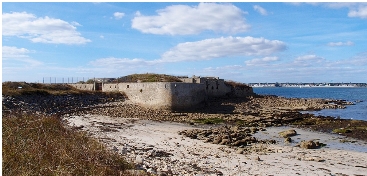
Le fort de Porh Puns à Gâvres fera l'objet d'une ouverture au public (à l'arrière-plan Lorient)