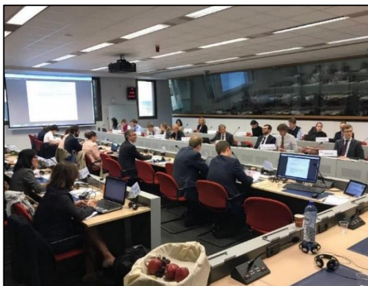
Réunion plénière du REC à Bruxelles

Les réunions plénières du REC se sont tenues à Bruxelles les 13 mars et 23 octobre 2018.